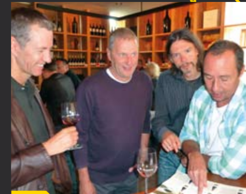
Unsere »Alt-Herren« im Weingut Manincor