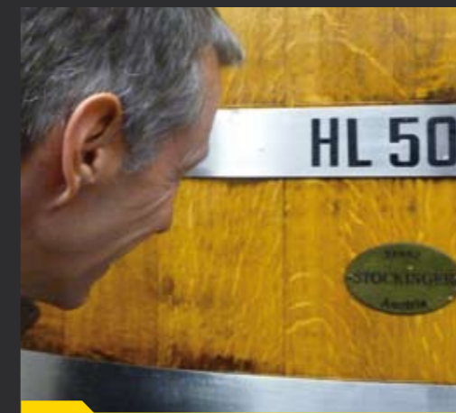
Ein ganzes Fass für Hr. Stockinger