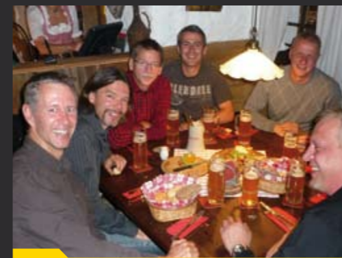
Unsere »Alt-Herren« - eine genütliche Truppe