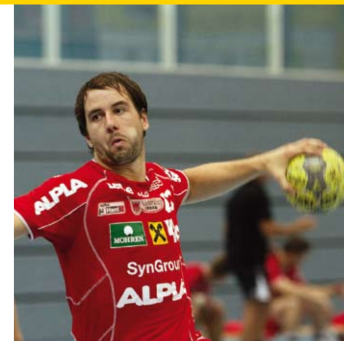
A1 Bregenz vs. Alpa HC Hard Donnerstag, 21.10.2010, 18:15 U20, 20:15 Handball-Arena Rieden/Vorkloster