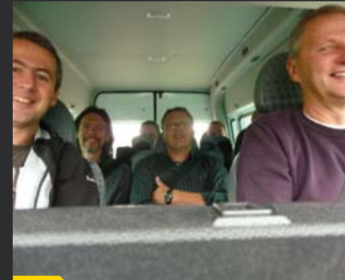
Los geht's in Richtung Südtirol!