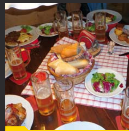
Eine zünftige Jausn zum Abschluss des Tages