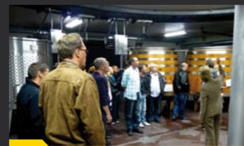
... man lernt nie aus!