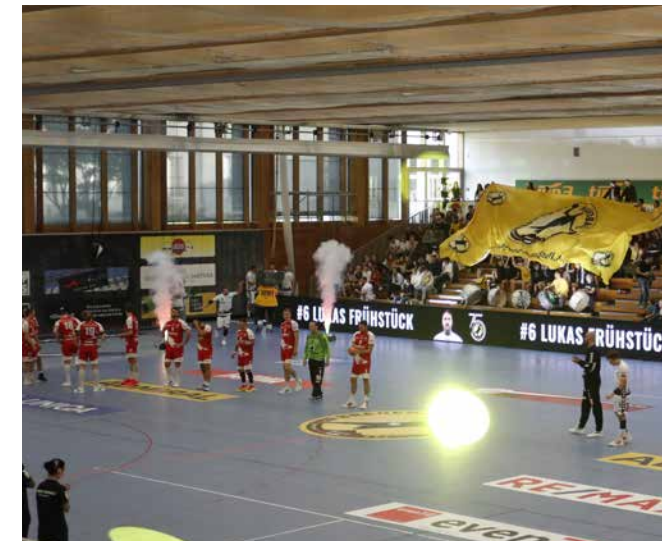
↑ Heimspiele in der Handball-Arena sind echte Events.