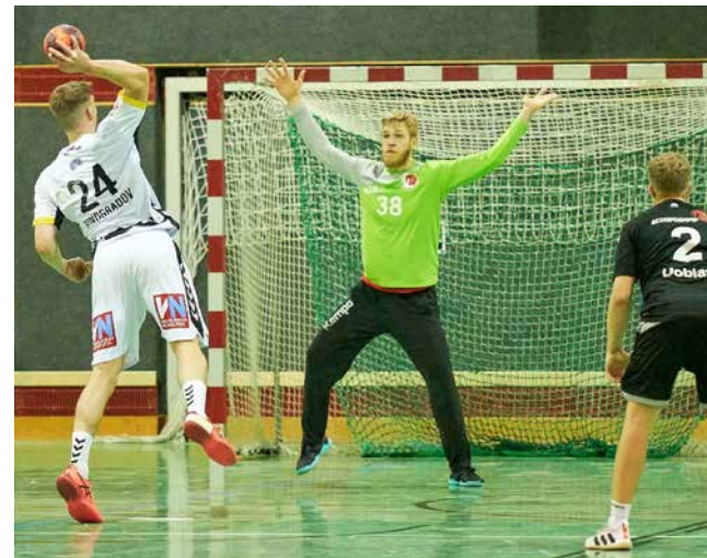
↑ Der Atzgersdorfer Torhüter macht sich groß und lässt sich nicht einschüchtern.