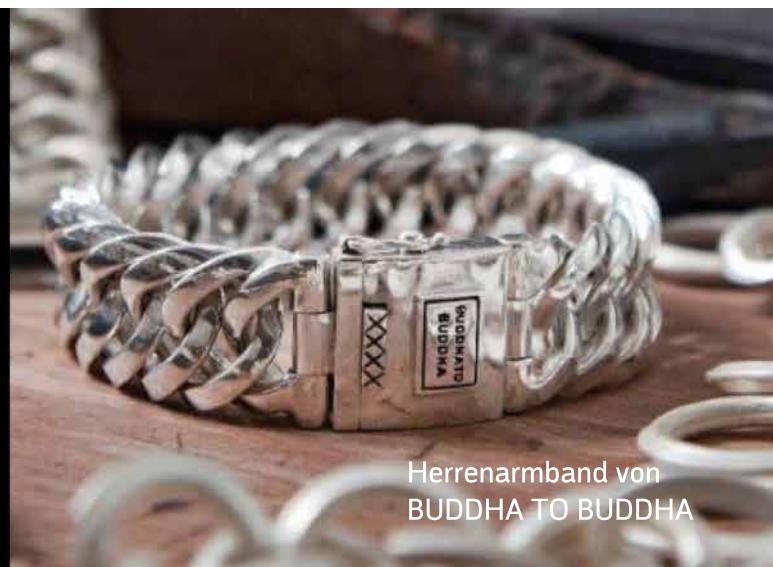
Herrenarmband von BUDDHA TO BUDDHA