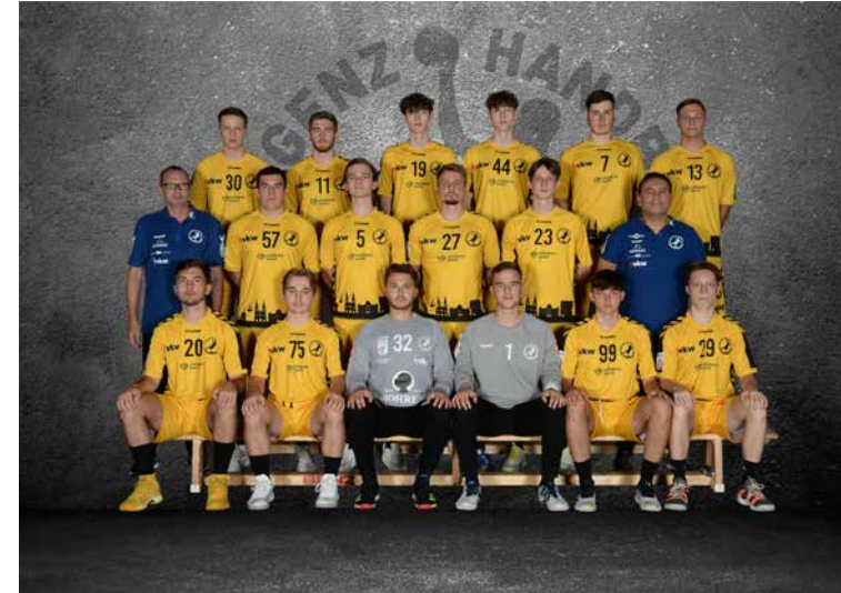
↑ Das „neue“ Future Team sammelt wertvolle Erfahrung in der HIA Challenge (2. Liga).